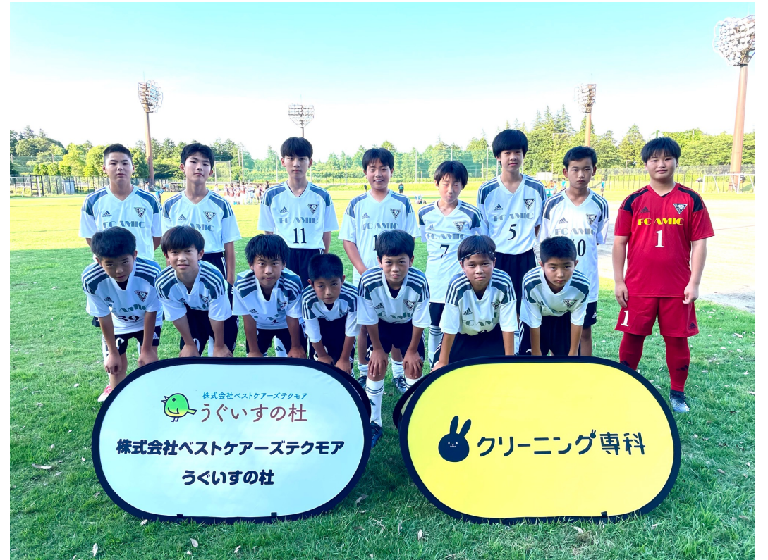
中学1年生の公式リーグ戦