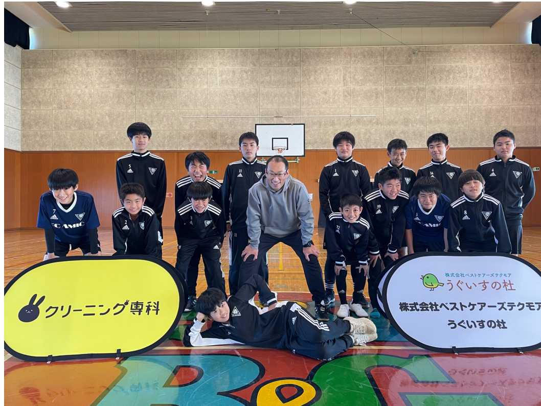
メンタルトレーニング実践会