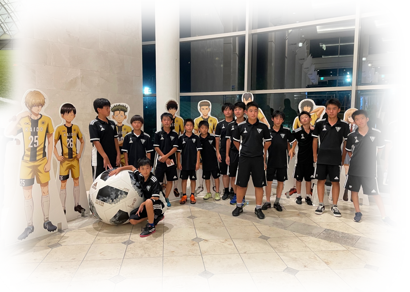
福島県Jヴィレッジでの強化合宿